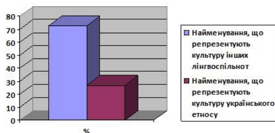
Рисунок 1. Лінгвокультурні параметри глутонійних найменувань

іншокультурних глутонічних найменувань, що маніфестують взаємозбагачення культур. Відтак, наше завдання полягає у проведенні соціолінгвістичного анкетування для того, аби з'ясувати правомірність і доцільність уживання тих чи тих іншокультурних номенів не лише у сучасній прозі, але й безпосередньо в українській мові, окреслити вплив глобалізаційних процесів, описати їхні переваги та недоліки за допомогою відповідей респондентів.