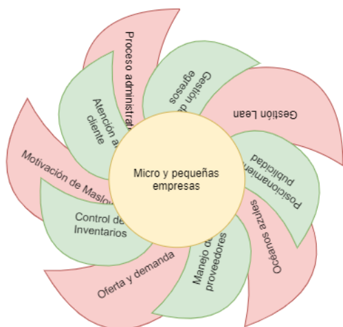
Fig. 4.- Modelo “Relación teoría – práctica”. Elaboración propia.

Por ende, la vinculación entre enfoques hasta cierto punto divergentes, aunque con objetivos afines en contraposición con la problemática, coadyuva a realizar propuestas con tendencia a lo holístico en el entorno actual mexicano.