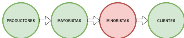
Fig. 3.- Canal de distribución tradicional Elaboración propia.

Si bien los servicios no pueden del todo ser transportados como los bienes o materias primas, y son producidos y consumidos en el mismo sitio, sí que requieren entradas a manera de insumos o materia prima para ser producidos.